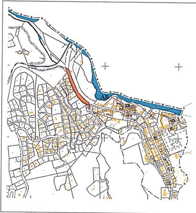
Situation dans la ville

(Les plans aux échelles réglementaires figurent dans les dossiers DUP et enquête parcellaire)