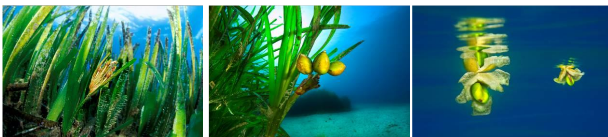
1. La fleur de Posidonia oceanica ; 2. Trois fruits dans l'herbier ; 3. Graine et fruits de posidonie en train de flotter.

La Posidonie, Posidonia oceanica (L.) Delile, est une phanérogame endémique de la mer Méditerranée qui peut constituer de véritables prairies sous marines. Cette plante angiosperme est constituée de faisceaux de feuilles, de racines et de rhizomes, qui sont des tiges rampantes ou dressées, généralement enfouies dans le sédiment. On nomme « matras » l'ensemble constitué par les rhizomes, les écailles (gainés des feuilles caduques), les racines et par le sédiment qui remplit les interstices. Exceptées les feuilles, les parties mortes de la plante sont peu putrescibles, ce qui explique leur longue conservation (plusieurs siècles ou millénaires) à l'intérieur de la matras (Boudouresque et al. , 2006). La matras sert d'ancrage à l'herbier mais joue également un rôle